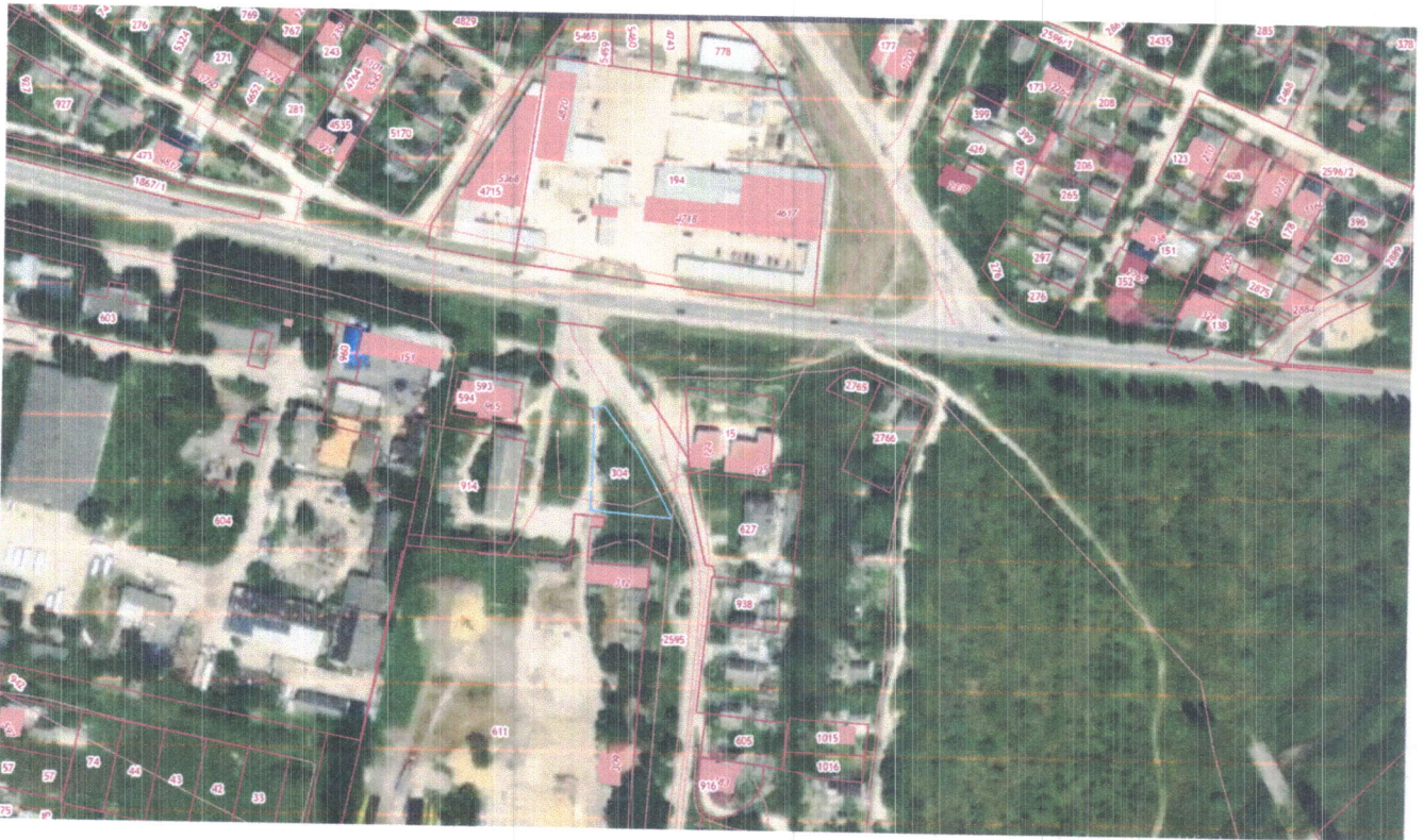
Схема границ территории проектирования, расположенной по адресу: Республика Крым, Белогорский район, город Белогорск, ул. Спаи, (возле ПАО "Крыммолоко"), земельный участок с кадастровым номером 90:02:010107:304