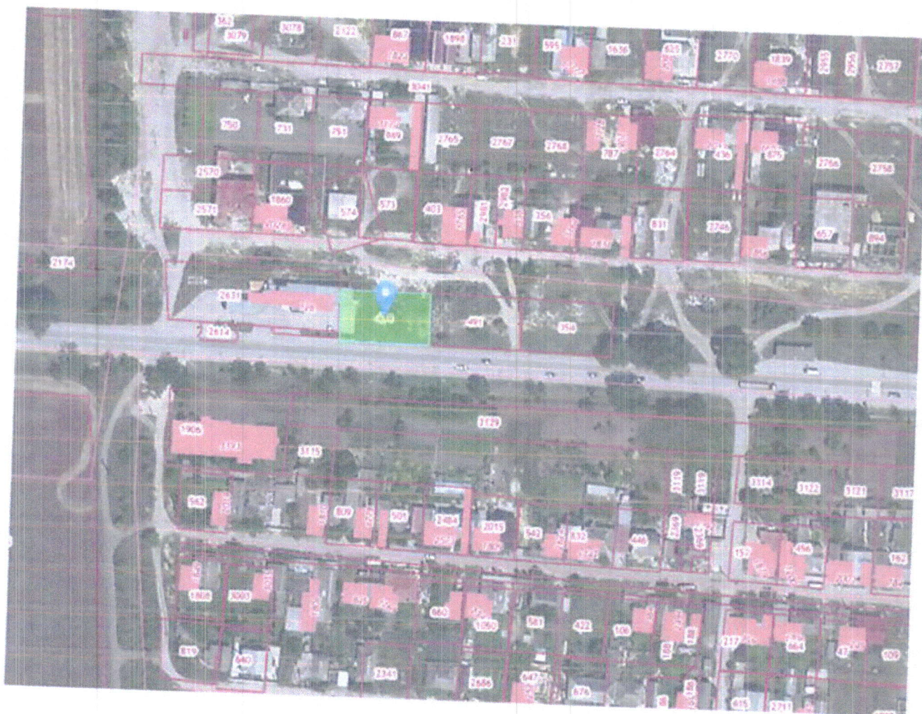
Схема границ территории проектирования, расположенной по адресу: Республика Крым, Белогорский район, город Белогорск, мкр. Сары-Су, вдоль автодороги Симферополь-Керчь, земельный участок с кадастровым номером 90:02:010101:494