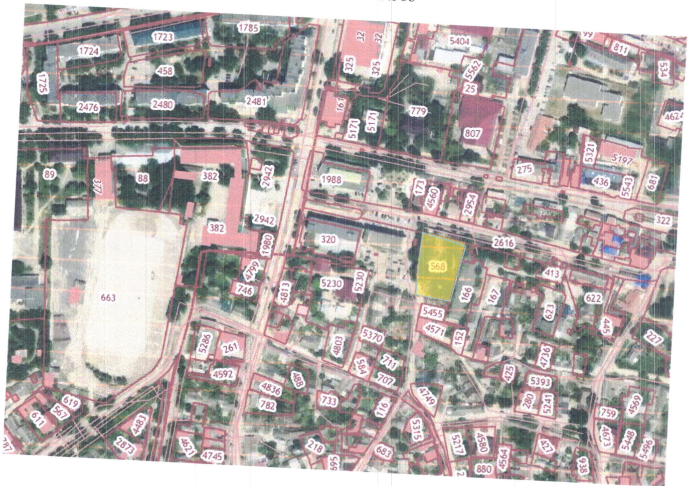
Схема границ территории проектирования, расположенной по адресу: Республика Крым, город Белогорск, ул. Бекира Чобан-заде, уч.3, земельный участок с кадастровым номером 90:02:010105:568