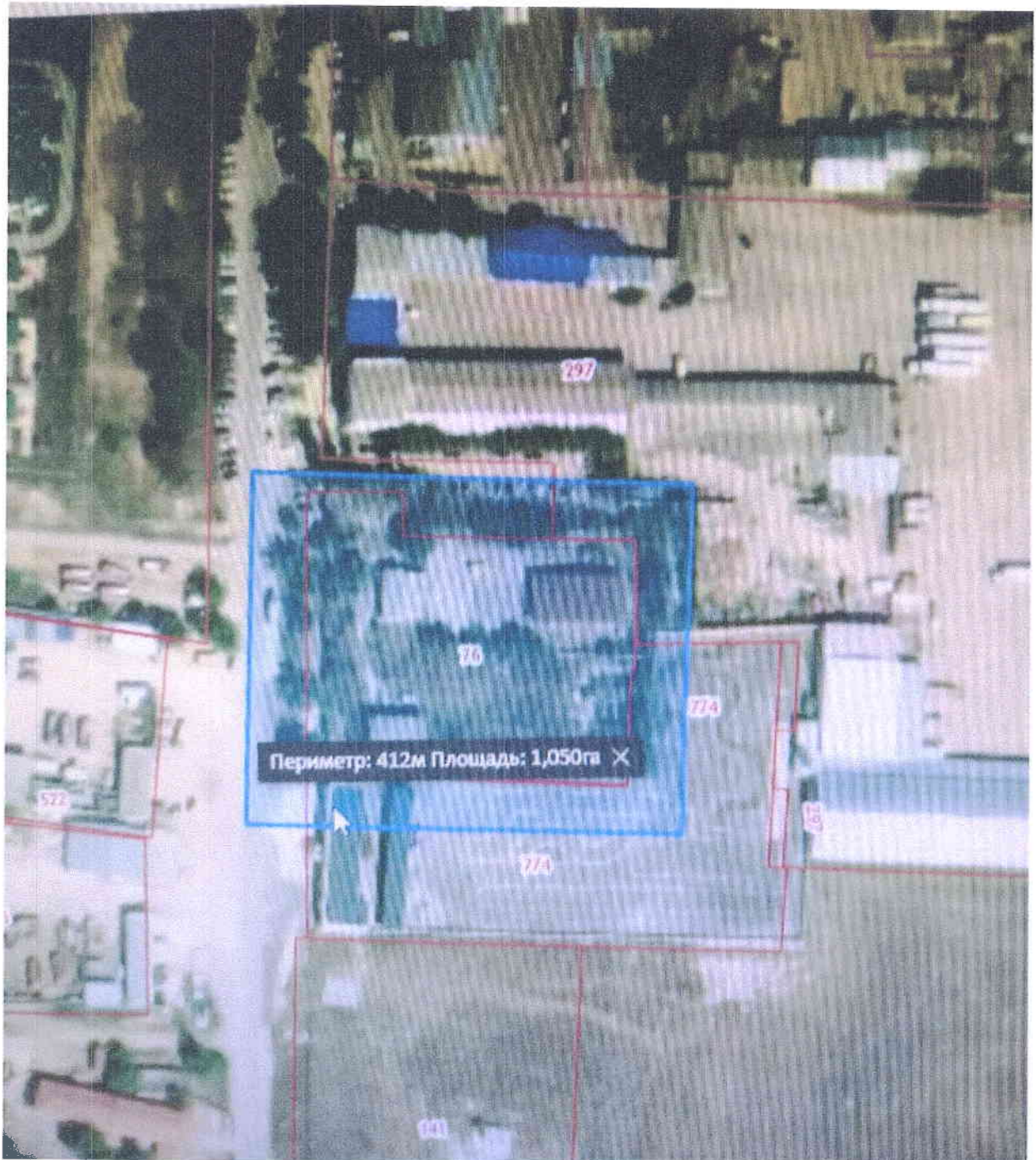
Схема территории проектирования

Приложение 1 к постановлению администрации города Белогорск Белогорского района Республики Крым от 18 декабря 2020 год № 827-17