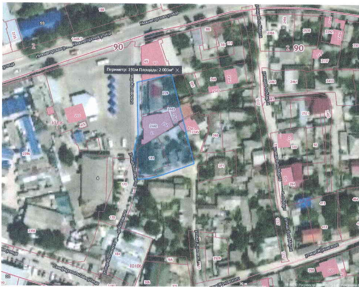
Схема территории проектирования

Приложение 1 к постановлению администрации города Белогорск Белогорского района Республики Крым от 12 февраля 2021 год № 95-17