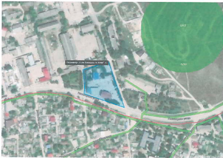
Схема территории проектирования

Приложение 1 к постановлению администраций города Белогорск Белогорского района Республики Крым от 15 июля 2021 года № 450-П