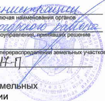
Схема расположения земельного участка или земельных участков на кадастровом плане территории г. Белогорск, ул. Индустриальная (между ГУП РК "Крымгазсети" и Газовой АЗС)

Губернатор (наименование документа об утверждении, включая наименования органов города Белогорск Белогорского района государственной власти или органов местного самоуправления, принявших решение Республики Крым об утверждении схемы или подписавших соглашение о перераспределении земельных участков) от 29 сентября 2016 г. № 047-П