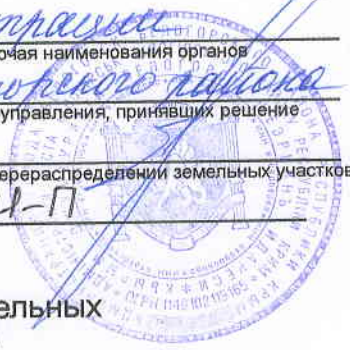
Схема расположения земельного участка или земельных участков на кадастровом плане территории г. Белогорск, ул. Нижнегорская (возле ГУП РК "Крымавтодор")

Утверждение Администрации (наименование документа об утверждении, включая наименования органов города Белогорск Белогорского района государственной власти или органов местного самоуправления, принявших решение Республики Крым об утверждении схемы или подписавших соглашение о перераспределении земельных участков) от 29 сентября 2018 № 641-П