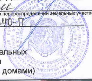
Схема расположения земельного участка или земельных участков на кадастровом плане территории г. Белогорск, ул. Н. Бойко (между многоквартирными домами)

поэтажное административное (наименование документа об утверждении, включая наименования органов г. Белогорск Белогорского района государственной власти или органов местного самоуправления, принявших решение Решением Краис об утверждении схемы или подписавших соглашение о перераспределении земельных участков) от 25 октября 2016 № 640-П