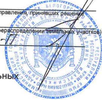
Схема расположения земельного участка или земельных участков на кадастровом плане территории г. Белогорск

(наименование документа об утверждении, включая наименования органов государственной власти или органов местного самоуправления, принявших решение об утверждении схемы или подписавших соглашение о перераспределении земельных участков) от 18 октября 2016 г. № 696-17