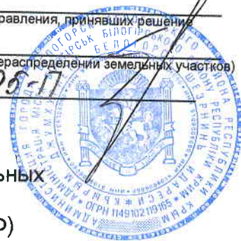
Схема расположения земельного участка или земельных участков на кадастровом плане территории г. Белогорск, ул. Н. Бойко (за автодромом ДОСААФ)