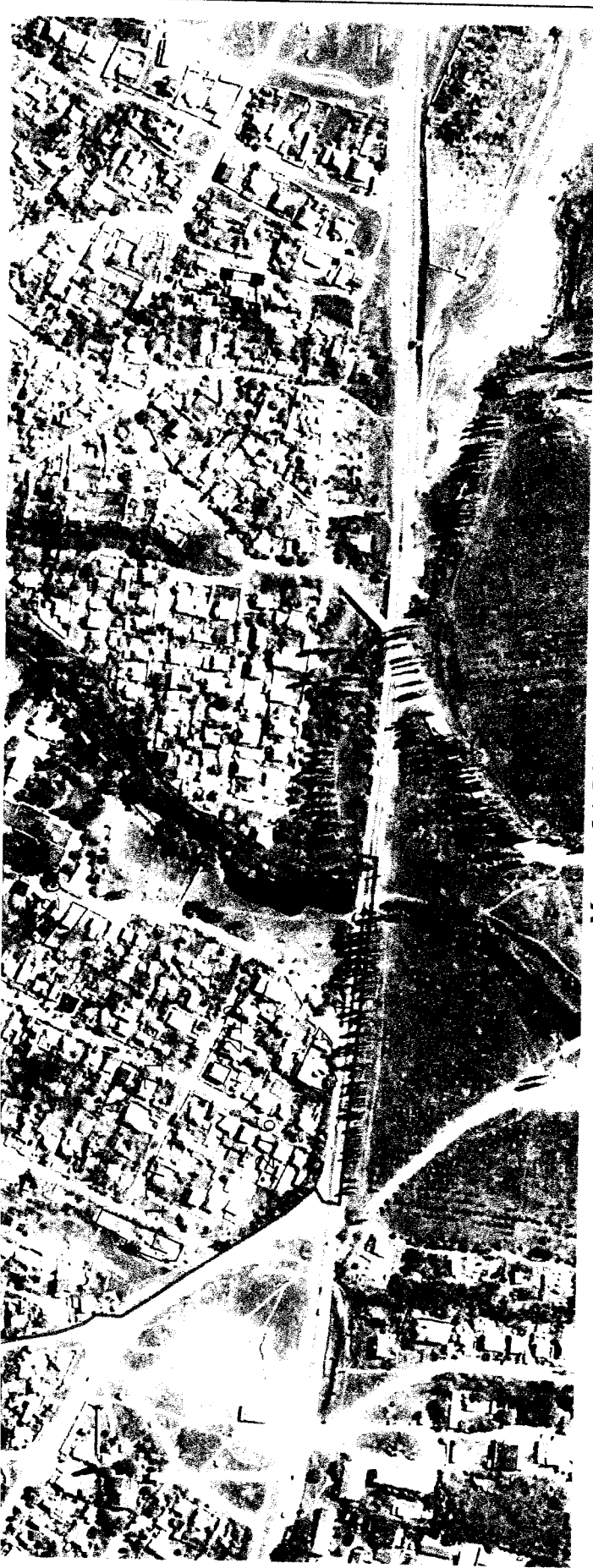
Масштаб 1:5 000