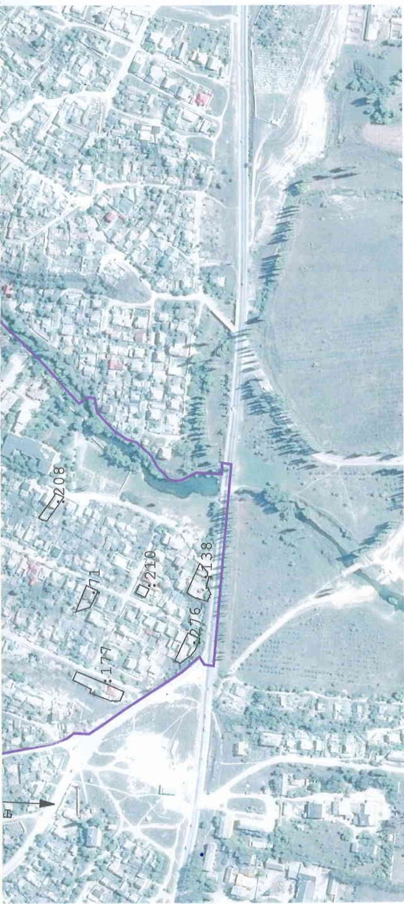
Масштаб 1:5 000