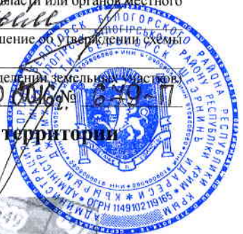
Схема расположения земельного участка на кадастровом плане территории кадастрового квартала 90:02:010106

или подписавших соглашение о перераспределении земельных участков от 18 февраля 2016 № 249-17