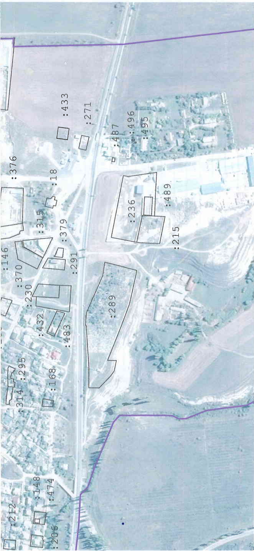
Масштаб 1:5 000