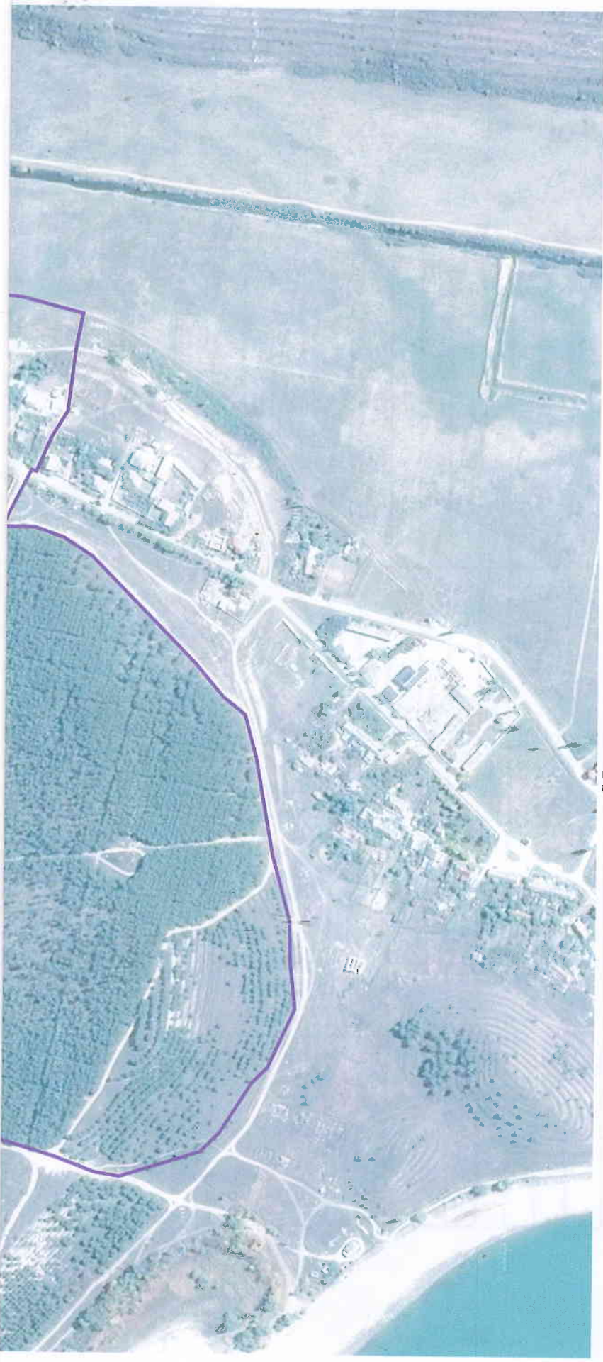
Масштаб 1:5 000