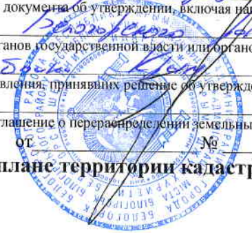
Схема расположения земельного участка на кадастровом плане территории кадастрового квартала 90:02:010101

Постановление Администрации г. Белогорск Республики Крым от _____ № _____ (наименование документа об утверждении, включая наименования органов государственной власти или органов местного самоуправления, принявших решение об утверждении схемы или подписавших соглашение о перераспределении земельных участков)