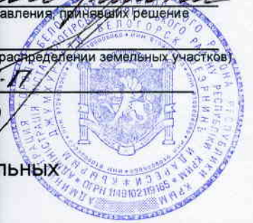
Схема расположения земельных участков на кадастровом плане территории г. Белогорск, ул. ...

Администрация городского района управления, принявших решение о перераспределении земельных участков