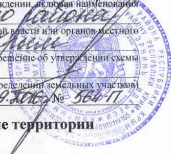
Схема расположения земельного участка на кадастровом плане территории кадастрового квартала 90:02:010109

или подписавших соглашение о перераспределении земельных участков) от 05.09.2016 № 564-П