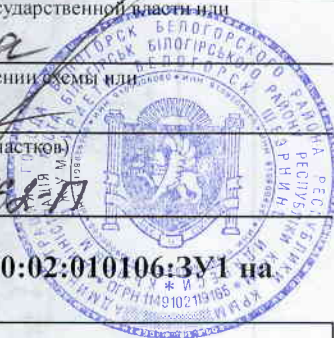
Схема расположения земельного участка с условным номером 90:02:010106:3У1 на кадастровом плане территории