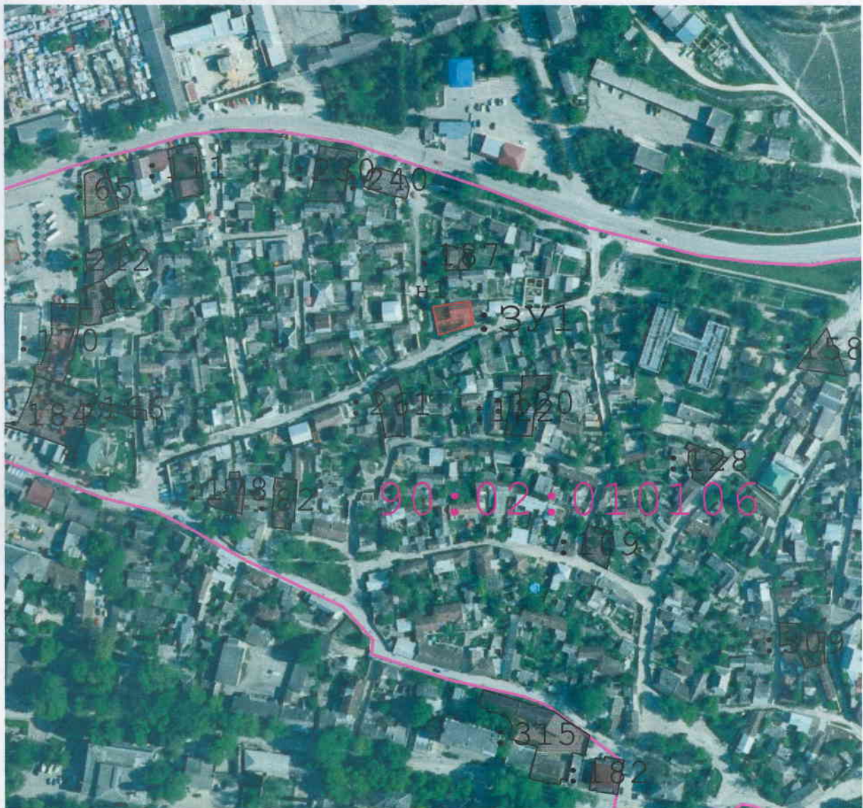
Масштаб 1:3 000