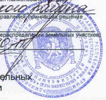
Схема расположения земельного участка или земельных участков на кадастровом плане территории г. Белогорск, ул. Красная, 3а

установление административных (наименование документа об утверждении, включая наименования органов г. Белогорск Белогорского района государственной власти или органов местного самоуправления, принявших решение Республиканские Крыше об утверждении схемы или подписавших соглашение о перераспределении земельных участков от 05.09.2016 № 560-10