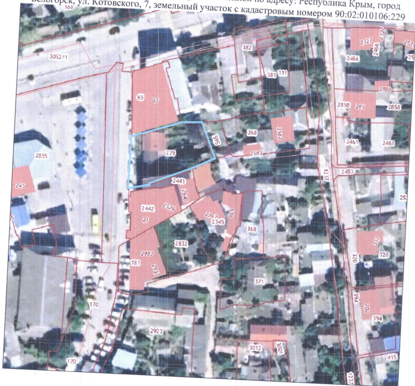
Схема границ территории проектирования, расположенной по адресу: Республика Крым, город Белогорск, ул. Котовского, 7, земельный участок с кадастровым номером 90:02:010106:229