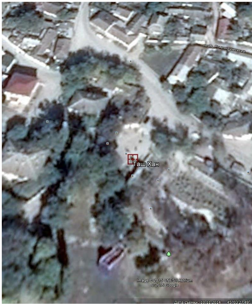
4. г.Белогорск ул.Котовского (район овощного рынка)